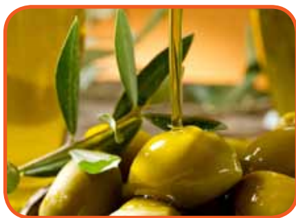
روغن زیتون برای سلامت قلب و عروق مفید است

◀ انواع روغن زیتون از لحاظ ترکیبات با یکدیگر متفاوت است؛ به طوری که ارزش تغذیه‌ای روغن زیتون بکر (تصفیه نشده) از روغن زیتون مخلوط و روغن زیتون تصفیه‌شده بیشتر است.